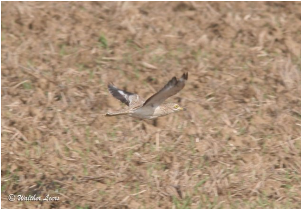
Oedicnème criard 25.08.07

Il semble que des champs de céréales puissent éventuellement convenir à cette espèce comme habitat de substitution. Qui prouvera la nidification de l'oiseau sur la plaine recevra un bac de la rédaction ...;-)