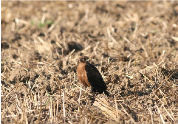
Busard cendré juvénile – Freek Verdonckt

Publication sans prétentions destinée à promouvoir la pratique de l'ornithologie de terrain dans les plaines agricoles