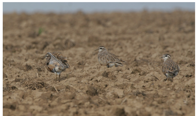
Pluviers guignards 25.08.07

Comme en 2004, un RALE DES GENETS chanteur est découvert par G. Cathoor le 28.05 vers Ramillies dans un champ de froment (son crex-crex régulier s'entend difficilement parmi le véritable concert des Cailles des blés et des Bruants proyers ) l'oiseau sera entendu au moins jusqu'au 14.06 mais sans suite perceptible. Un second chanteur de cette espèce a pu également être présent le 09.06 mais il pouvait aussi s'agir du premier oiseau se déplaçant dans une cuvette relativement grande. Quel statut attribuer à cette espèce discrète dans nos plaines agricoles ? La question reste ouverte mais ces oiseaux sont probablement des candidats nicheurs (peut-être d'origine lointaine) délocalisés suite à la fauche hâtive des parcelles dans lesquelles ils s'étaient installés initialement à leur retour de migration.