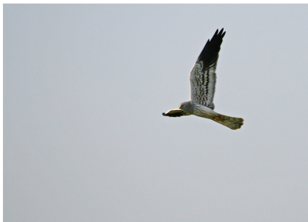
Le « Baron gris » dans ses œuvres une scène qui sera attendue avec impatience dès la fin avril 2008 !