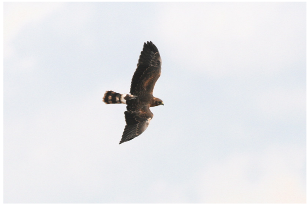
Busard cendré juvénile