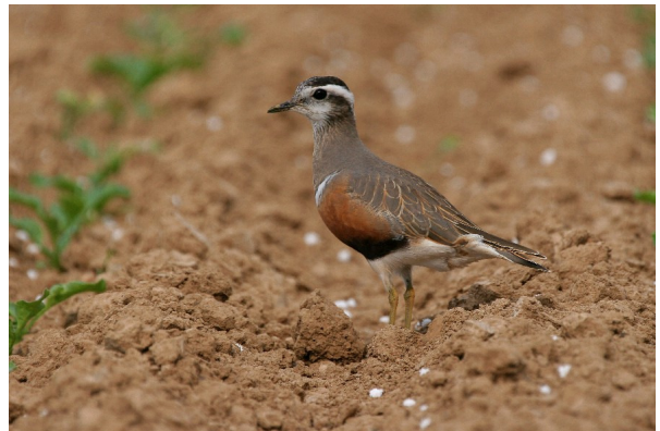
Pluvier guignard 03.05.2007

Le lendemain, 4 oiseaux (3 Ad + 1 Juv.) rejoints en milieu de journée par un nouvel adulte décollent vers 16h30. Suivent deux jours sans données puis le 24 au matin 5 oiseaux sont observés en vol et un groupe de 6 (min. 1 juv.) est trouvé le soir dans le même champ qu'un OEDICNEME CRIARD juvénile. L'Oedicnème séjournera jusqu'au lendemain et les guignards seront 10 ce jour là sur une parcelle adjacente. Le 26 c'est un groupe de 16 (8 ad. Et 8 juv.) qui est trouvé sur le champ de pois initial. Par la suite, 4 juvéniles séjourneront du 30 au 31 dans un champ de pois tout proche de la N256 à quelques centaines de mètres des premières maisons ! Le dernier oiseau de l'automne est vu en vol le 10.09. 2007 est une excellente année pour cette espèce toujours emblématique elle se place cependant bien loin après l'année « record » de 2004 (59 oiseaux cette année pour 129 en 2004).