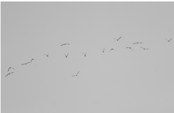
16 Pluviers guignards 26.08.07 – J. Fouage

Le lendemain, 4 oiseaux (3 Ad + 1 Juv.) rejoints en milieu de journée par un nouvel adulte décollent vers 16h30. Suivent deux jours sans données puis le 24 au matin 5 oiseaux sont observés en vol et un groupe de 6 (min. 1 juv.) est trouvé le soir dans le même champ qu'un OEDICNEME CRIARD juvénile. L'Oedicnème séjournera jusqu'au lendemain et les guignards seront 10 ce jour là sur une parcelle adjacente. Le 26 c'est un groupe de 16 (8 ad. Et 8 juv.) qui est trouvé sur le champ de pois initial. Par la suite, 4 juvéniles séjourneront du 30 au 31 dans un champ de pois tout proche de la N256 à quelques centaines de mètres des premières maisons ! Le dernier oiseau de l'automne est vu en vol le 10.09. 2007 est une excellente année pour cette espèce toujours emblématique elle se place cependant bien loin après l'année « record » de 2004 (59 oiseaux cette année pour 129 en 2004).