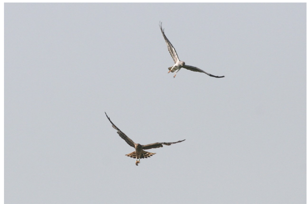
Busard cendré, passage de proie chez le couple de Jandrenouille – Freek Verdonck (la femelle de ce couple porte une bague posée en Allemagne).

En effet, comme d'habitude, les busards ont choisi de s'installer dans la céréale la plus hâtive, les moissons sont d'ores et déjà programmées pour début juillet, les jeunes éventuels ne seront pas encore volants : une intervention est donc indispensable ! La délicate opération a lieu le 30.06, les deux nids (et un troisième à Villers-le-Peuplier) sont protégés dans la foulée au moyen d'un cercle de 3 mètres de rayon de grillage « à poules » soutenu par des piquets métalliques. Cette protection sommaire est autant destinée à délimiter l'emplacement du nid à l'attention de l'agriculteur (le cercle grillagé ressort légèrement du champ) qu'à empêcher les jeunes busards de quitter le nid au passage de la moissonneuse. Pour éviter une prédation (mustélidé, renard,...) suite aux traces de passage dans le champ, un puissant répulsif est généreusement répandu.