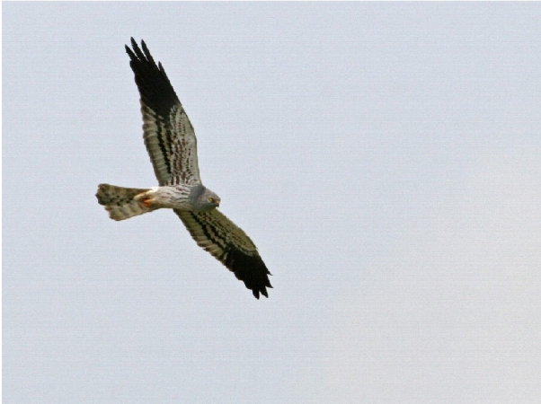
Busard cendré mâle adulte

Il va sans dire que les espoirs étaient grands cette année après la déception causée à toute l'équipe par l'échec de la nichée de Ramillies en 2006. Dès la fin avril, les premiers Busards cendrés sont repérés à Boneffe sud au dessus d'une belle parcelle d'escourgeon. Début mai parades, passages de proies et construction d'un nid attestent de l'installation d'un couple nicheur qui sera suivi durant de longues heures par la petite équipe de bénévoles motivés. Mais ce n'est pas tout, d'autres oiseaux sont régulièrement signalés dans la plaine nord et même plus loin, les recherches s'intensifient et un transport de matériaux par une femelle est repéré début juin sur les hauteurs de Jandrenouille, Bingo ! Un second couple est bel et bien installé « aux confins » de la plaine nord (également en escourgeon) et semble très actif. Immédiatement, contact est pris avec les agriculteurs qui exploitent ces parcelles.