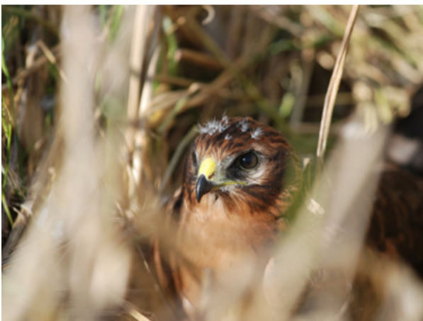
Un des rejetons de Jandrenouille (photo prise lors de la pose d'une protection électrique supplémentaire autour du nid) – B. Bataille.