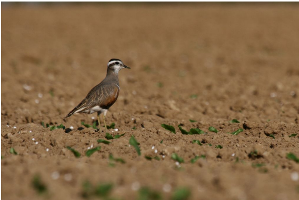
Pluvier guignard 04.05.2007

Une première pour la plaine cette année avec l'observation d'un oiseau isolé en halte lors de sa migration pré-nuptiale ! Trouvé le 03 tôt au matin, il séjournera dans la même parcelle de jeunes betteraves jusqu'au 05.05 ! Mais pour cette espèce le meilleur est à venir, en août à la faveur d'un temps pluvieux « idéal », il faut attendre le 20 pour trouver un, puis deux, puis 11 oiseaux (10 Ad. + 1 Juv.) dans un champ de pois de la plaine nord.