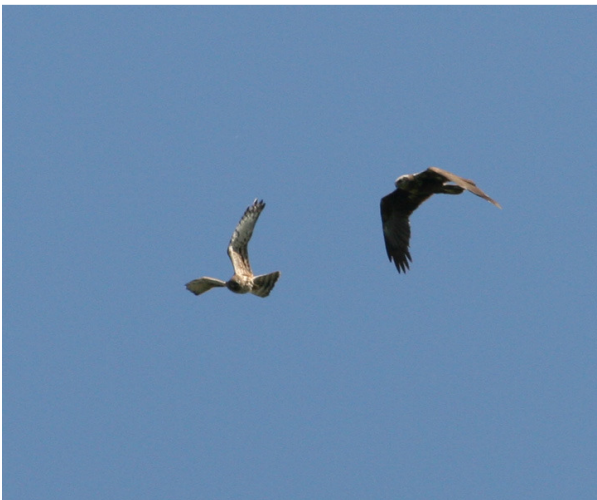
Insolite : la femelle du couple de Boneffe sud défend son nid contre un Busard des roseaux trop curieux à son goût